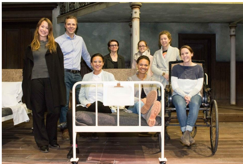
Vor der Hauptprobe Csárdásfürstin Opernprojekt des Wahlfachs im WS17/18

**Theater Münster: Neubrückenstraße 63, 48143 Münster /Probephöhne Oxford-Kaserne, Roxeler Straße