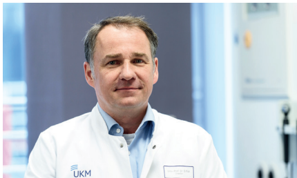
Prof. Dr. med. Dirk Föll

Die Versorgung von Kindern und Jugendlichen mit rheumatischen oder immunologischen Erkrankungen findet heute hauptsächlich ambulant statt, daher sind wir überwiegend im Bereich der Sprechstunden tätig. Allerdings machen schwere Verläufe oder Komplikationen nicht selten eine stationäre Behandlung notwendig. Deshalb ist es von großer Bedeutung, am UKM die Möglichkeit zur Versorgung auch schwerstkranker Patient*innen mit Kinderrheuma oder Immundefekten anbieten zu können. Im Falle eines stationären Behandlungsbedarfes werden unsere Patient*innen auf den Stationen des Zentrums für Kinderheilkunde und Jugendmedizin kompetent betreut.